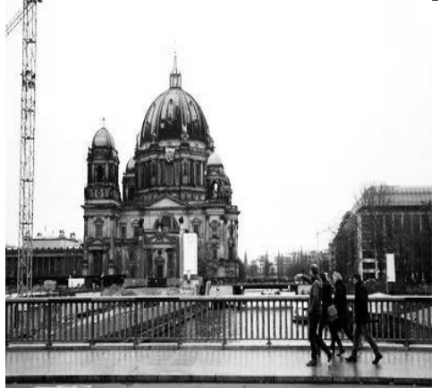
(Solidaridad con l@s 5 anarquistas en Barcelona. Lienzo colgado en Catedral de Berlín, Alemania)