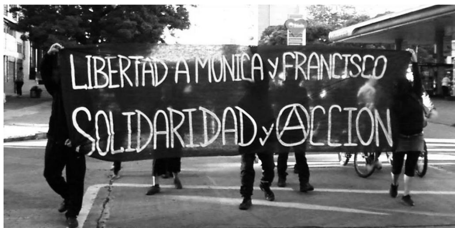
(Mitin en las afueras de la embajada de España en Uruguay. Diciembre 2013)

Diciembre 2013/sinbanderas.nifronteras@riseup.net