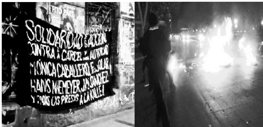
(Barricadas y propaganda en "La Alameda", principal avenida de Santiago, Chile. Diciembre 2013)