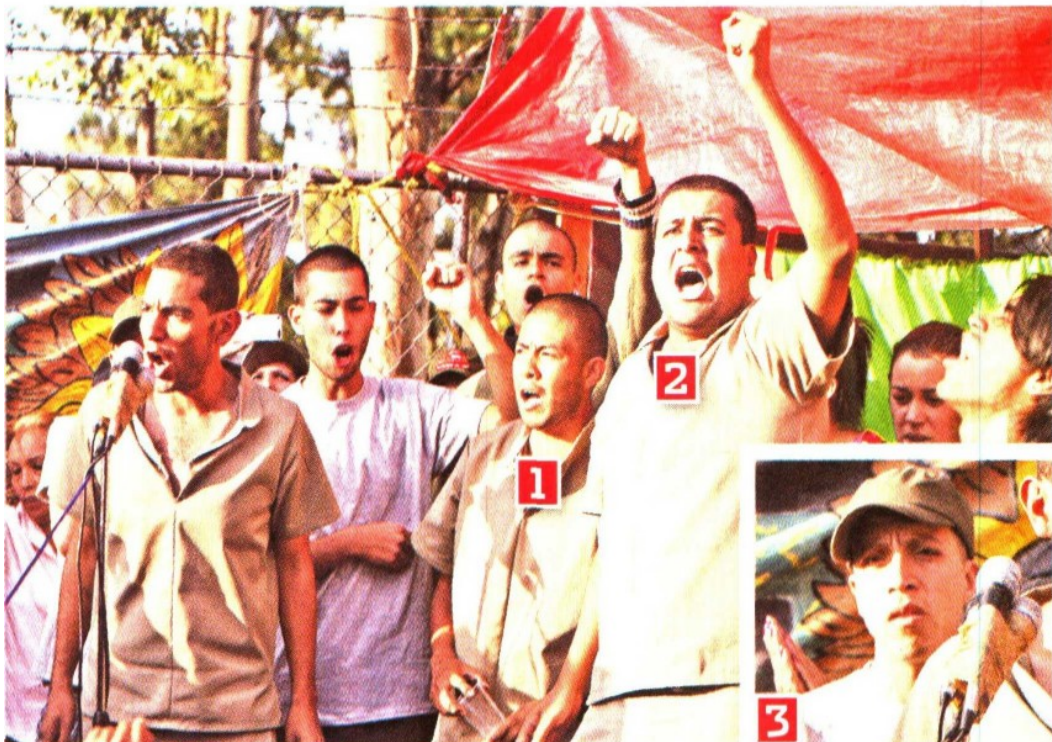
LANZAN SU GRITO. Tras garantizar una fianza de 171 mil pesos, los siete acusados de actos vandálicos en la marcha del 10 de junio dejaron la cárcel y a gritos dijeron ser perseguidos políticos.